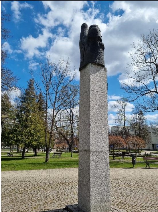
Unikalus kodas Kultūros vertybių registre – 20590