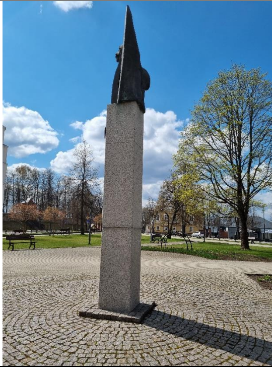
Unikalus kodas Kultūros vertybių registre – 20590